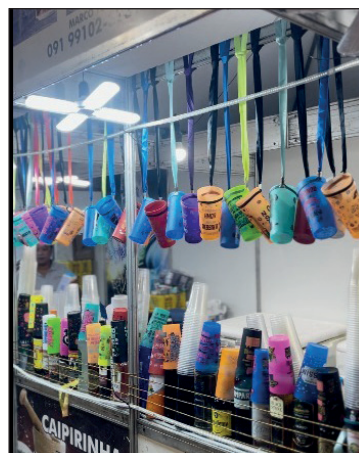
A festa gerou oportunidade para microempreendedores e vendedores ambulantes, que ampliaram suas vendas durante o evento