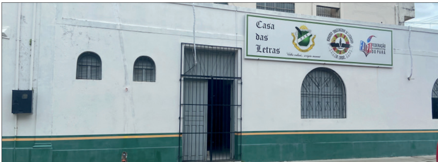
Prédio sede da Academia Altamirense de Letras, na Travessa Paula Marques, no Centro da cidade

Além disso, não são somente os escritores que têm histórias para contar. O prédio destinado à academia já passou por várias transformações: já foi açougue municipal, mercado público, conselho tutelar, biblioteca e base censitária para o Instituto Brasileiro de Geografia e Estatísticas (IBGE). Agora, torna-se a casa dos intelectuais de Altamira e região.