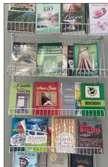
Parte do acervo de livros da casa de letras de Altamira

“Somos guardiões das letras aqui, da língua portuguesa. Guardamos memórias da história da região, e o nosso objetivo é difundir as letras, fazer com que as pessoas leiam, escrevam e publiquem”, destaca a presidente da