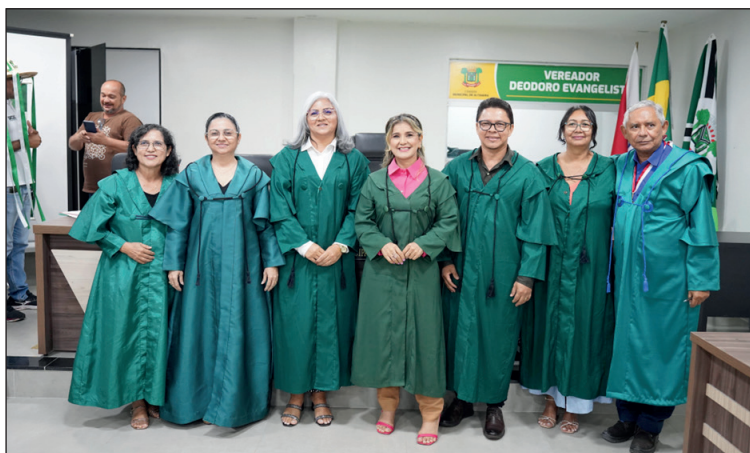
Acadêmicos altamirenses reunidos durante sessão

A AAL abre para visitas duas vezes por semana: terça-feira: das 9h às 11h30, e quarta-feira: das 14h às 17h. Atualmente, a Academia conta com presidente, vice-presidente, secretária, tesoureira, bibliotecária, assessor cultural e assessoria jurídica, todos trabalhando para a manu-